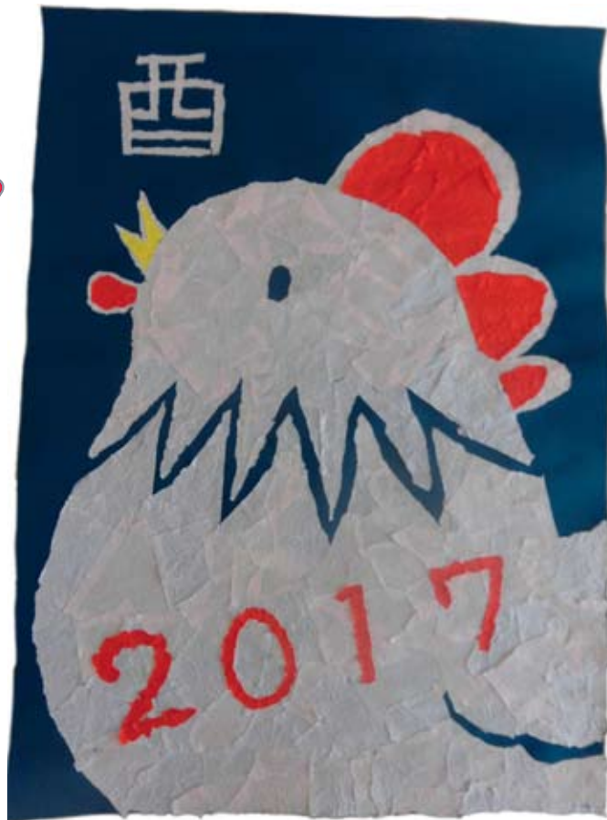
リハビリ科のオリオングループのメンバーが綺麗な紙をちぎり、今年の干支を作りました。今年も良い年になりますように。