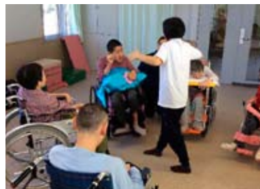
グループ活動の様子